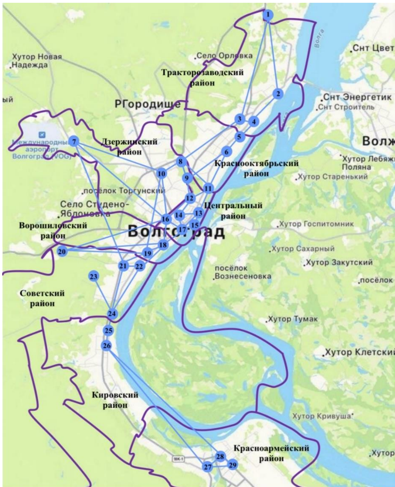
Рисунок 4 – Разработанная модель мультимодальной транспортной сети г. Волгограда