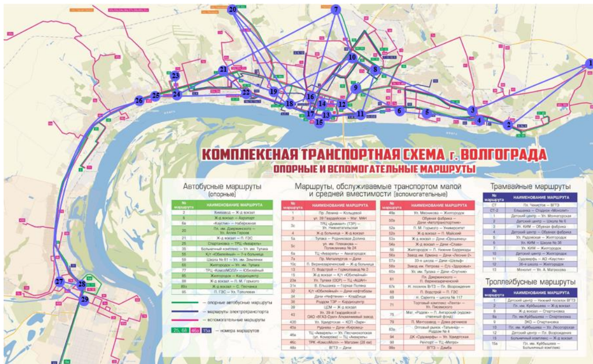
Рисунок 6 – Комплексная транспортная схема г. Волгограда с предлагаемыми мультимодальными ТПУ