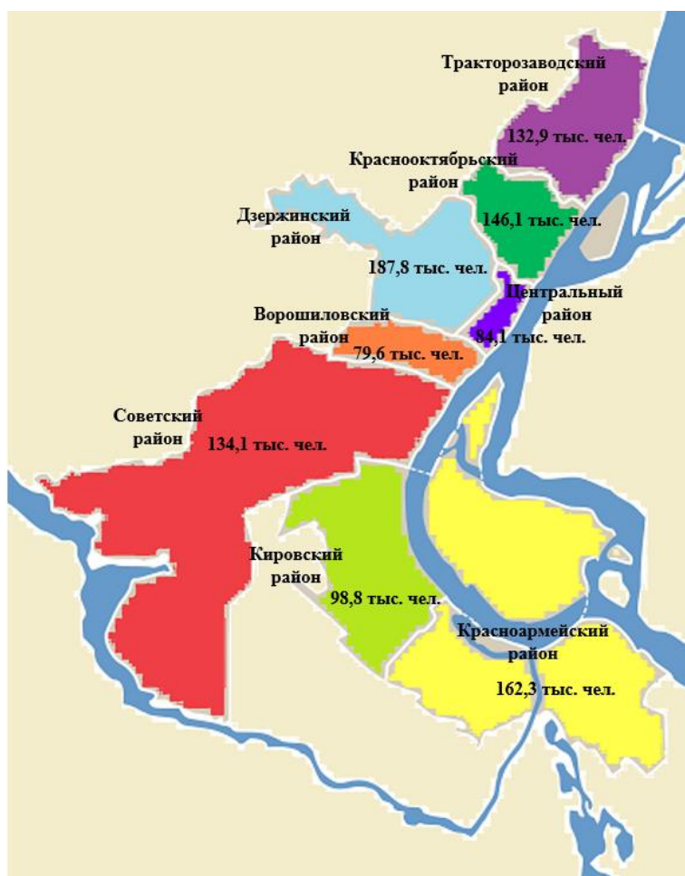
Рисунок 2 – Схема распределения численности населения по административным районам г. Волгограда (данные 2024 г.)

Количество и расположение ТПУ в городе связано с количеством населения, проживающего в районах, зависит от значимости административного района (промышленной, культурной, развлекательной и др.) и от транспортной подвижности населения, а также от выходных линий транспорта в агломерацию. На рис. 2 приведена схема распределения численности населения по административным районам г. Волгограда за 2024 г.